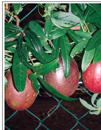
Пассифлора зреет в декабре — «Источник Жизни-7».

www.levashov.org www.levashov.info www.levashov.name