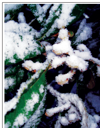
Японская слива в снегу — «Источник Жизни-4».

по специально созданной программе и обеспечивающего им всю необходимую защиту. Уникальные результаты, зафиксированные на многочисленных фотографиях, включённых в статьи, не оставляют никаких сомнений в их подлинности и в реальности того, что на них запечатлено. Полезность и важность этих результатов для человечества невозможно переоценить: они говорят о том, что урожайность можно увеличивать в разы , без истощения и убийства почвы. Внимательный читатель сразу поймёт все преимущества, предоставляемые