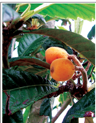
Японская слива созрела — «Источник Жизни-4».

Жизни» автор рассказывает и показывает результаты работы специального Генератора пси-поля, созданного им и размещённого в своём имении во Франции. Этот генератор, названный автором Источником Жизни и настроенный на воздействие только на определённую территорию, обеспечивает значительно более крепкое «здоровье», ускоренный рост и повышенную урожайность растений, посаженных в парке вокруг замка. Какие-либо химические удобрения, гербициды или пестициды не применяются вовсе, в этом нет никакой необходимости. Все растения очень крепкие и здоровые, благодаря воздействию Генератора, работающего