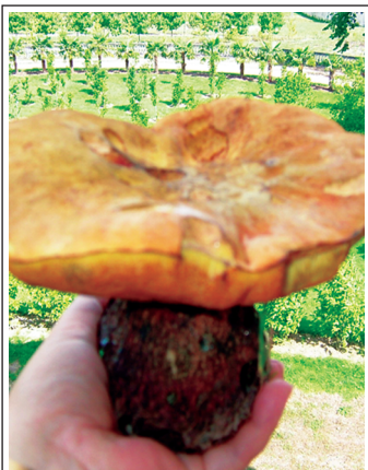
Килограммовый белый гриб — «Источник Жизни-1»