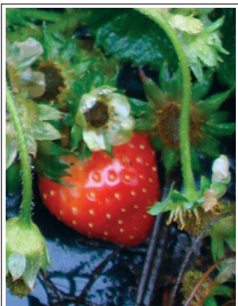
Клубника зреет в декабре — «Источник Жизни-7».

использованием подобных Генераторов: растения не нужно удобрять никакими ядами, которые почему-то называют химическими удобрениями, постоянно поливать, защищать от вредителей другими ядами, убивающими не только вредителей, но и сами растения. Генератор, следуя заложенной в него программе, воздействует на почву, благодаря чему, она постепенно преобразовывается оптимальным образом под нужды конкретного растения. Изменяя программу работы Генератора, автор воздействует на растения и изменяет их свойства